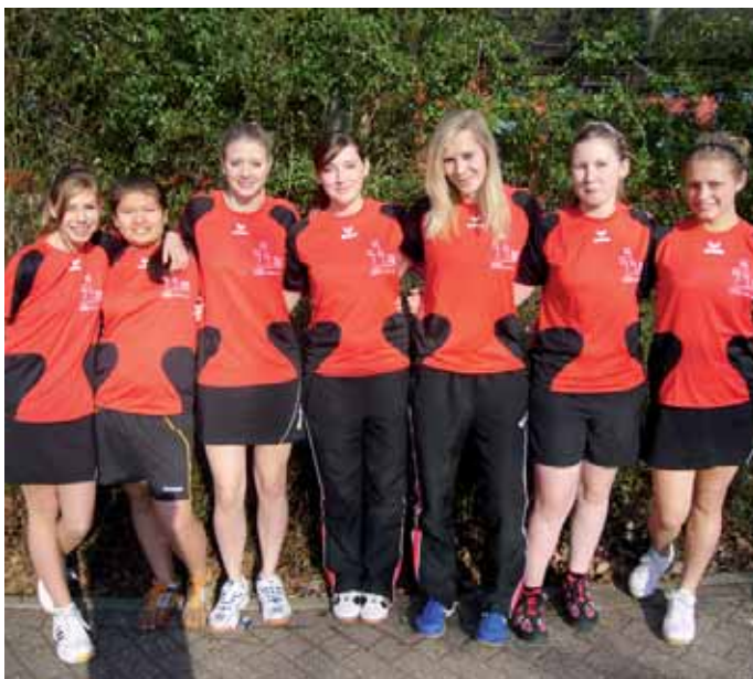
Nicht zu schlagen war die Mädchenmannschaft der Gesamtschule Schinkel – ohne Spielverlust sicherte sie sich das Ticket für das Landesfinale.