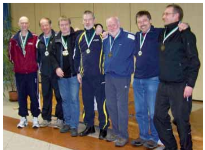
Die Garde der Sieger Herren 50.