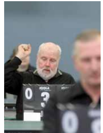
Auch wichtig und immer voll auf Ballhöhe: die Schiedsrichter.