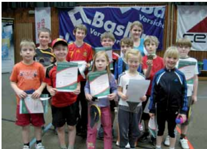
Minis MTV Hattorf