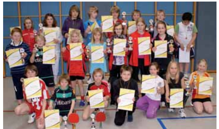
Stolz präsentierten die neuen Minimeister ihre Urkunden und Pokale.