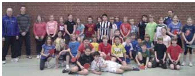
24 Mädchen und Jungen sorgten für Rekordbeteiligung bei den mini-Meisterschaften des Helmstedter Gymnasiums Julianum.