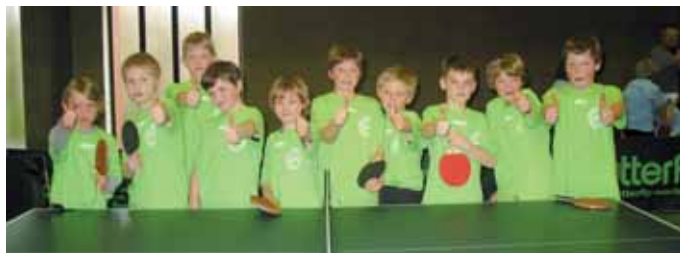
Die „Rundlaufteufel“ und die „Schmetterlinge“ des dritten und vierten Schuljahres bescherten der Grundschule Schepsdorf einen Triumph bei den Lingener Stadtmeisterschaften im Rundlauf-Team-Cup.

Die „Rundlaufteufel“ – so die selbst gewählte Mannschaftsbezeichnung – des dritten Schuljahres sicherten sich den Tagessieg. Es folgten die „Tischtennis-Killer“ der Erich-Kästner-Schule aus Lingen-Laxten und die „Crazy Soccers“ der GS Altenlingen. Auch beim vierten Schuljahr dominierte die GS