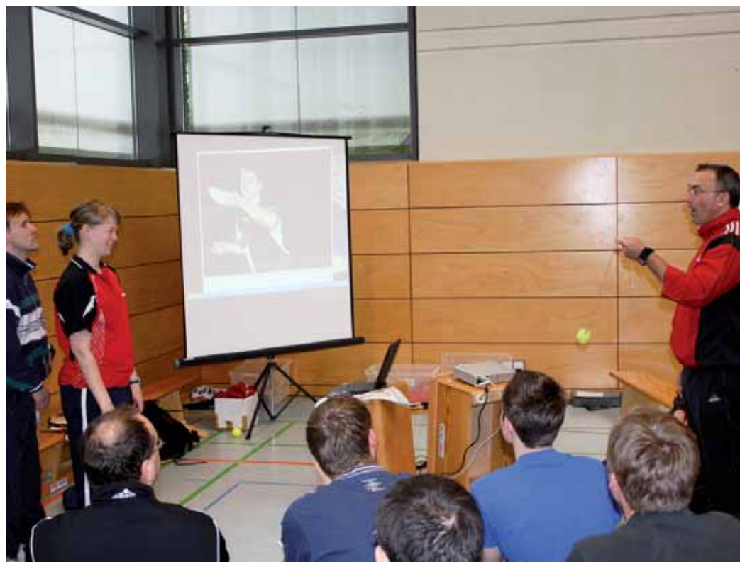
Seminare und Vorträge mit Fallbeispielen stehen bei den sportpraktischen Themen im Hörsaal und der Sporthalle im Mittelpunkt.

Das Thema Sozialkompetenz (im englischen Wortgebrauch auch soft skills genannt) ist gerade im Verein ein ganz bedeutendes. Denn mit sozialer Kompetenz werden die persönlichen Fähigkeiten und Einstellungen umschrieben die dazu beitragen, individuelle Handlungsziele mit den Einstellungen und Werten