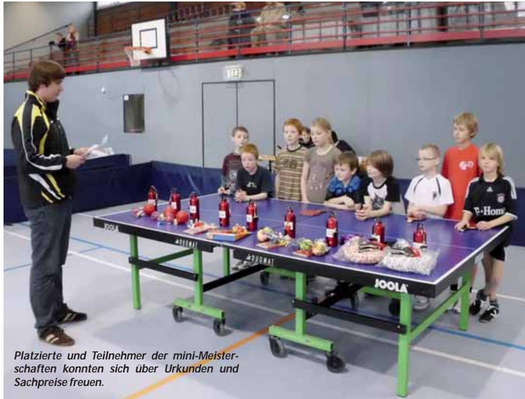
Platzierte und Teilnehmer der mini-Meisterschaften konnten sich über Urkunden und Sachpreise freuen.