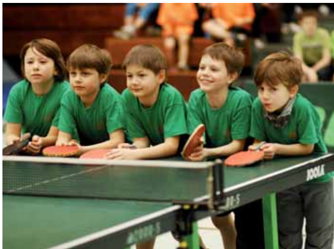
Sieger bei den dritten Klassen wurde die Grundschule Klint.

der nach dem Schlag die Spielhälfte gegen den Uhrzeigersinn wechselt und sich hinter dem letzten Spieler der anderen Seite stellt. Wer einen Ball nicht auf die andere Seite platziert, scheidet aus. Die beiden letzten Kinder am Tisch spielen den Sieger bzw. die Siegerin aus. Für den Wettkampf-Cup wurden die Spielregeln verfeinert. Es treten zwei Teams mit je vier Kindern gegeneinander an. Das Team, das zum fünften Mal den Sieger bzw. die Siegerin stellt, ist Mannschaftssieger. Jedes Team kann einen Ersatzspieler melden.