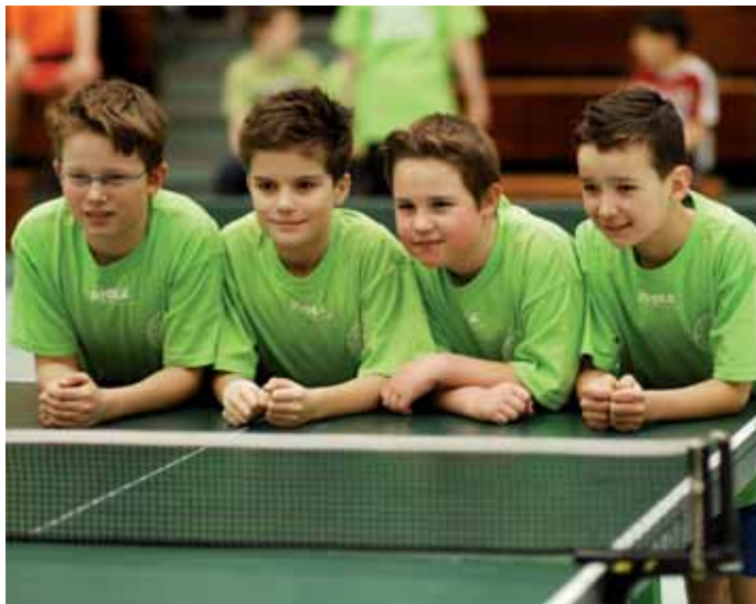
Bei den vierten Klassen gewann die Grundschule Waggum.