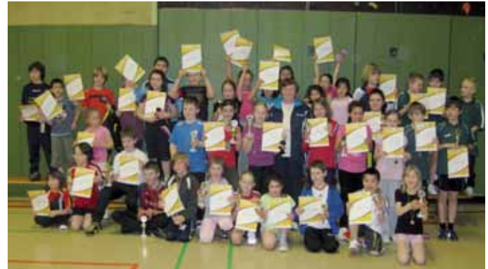
Die Stimmung war bestens bei den Teilnehmern des Mini-Kreisentscheids beim Post SV Bad Pyrmont.

„Die Jungen und Mädchen der Altersklassen II und III haben sich damit für den Bezirksentscheid qualifiziert“, informierte Pesch abschließend. Martina Emmert