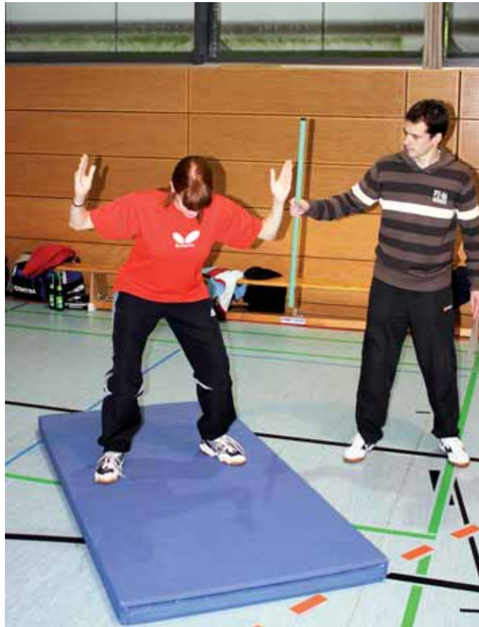
Auch kindgerechtes Krafttraining zählt beim Vereins- und Trainerkongress zu den Angeboten der unterschiedlichen Workshops.

Der Sportversicherungsvertrag des Landessportbundes. Welche „Grundabsicherung“ besitzt jeder im TTVN/LSB organisierter Verein und an welchen Stellen macht es Sinn, sich zusätzlich abzusichern?