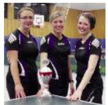
Die siegreichen Damen des Dahlenburger SK.