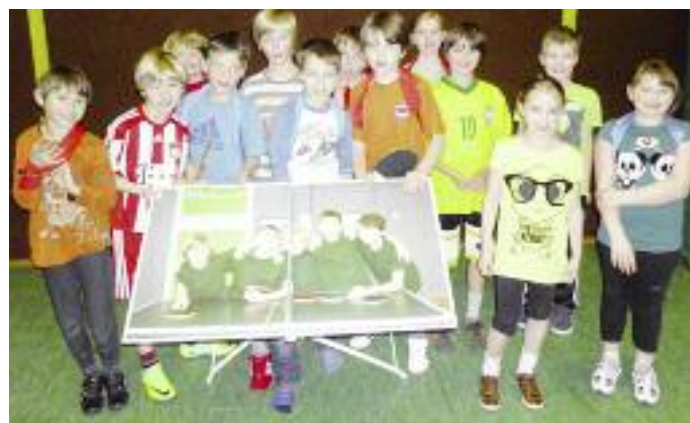
RTC-Lingen: Preisübergabe in der Castellschule im Sportunterricht.