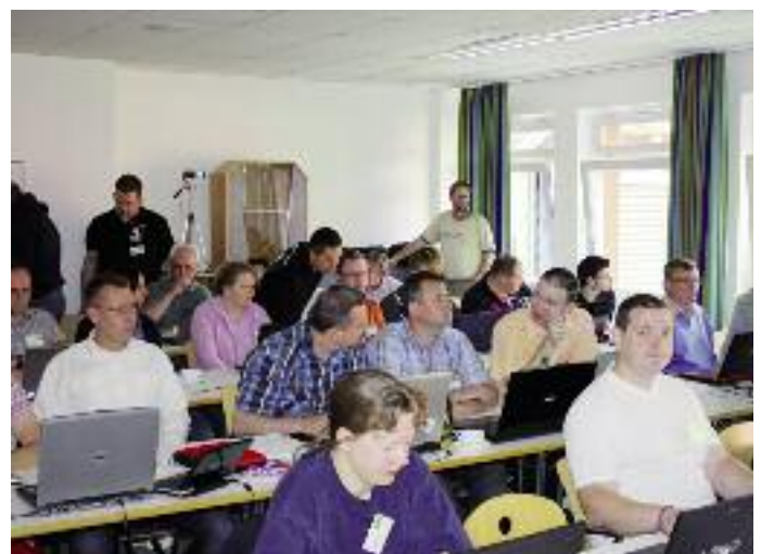
Viele Notebooks und interessierte Teilnehmer bei den drei Turniersoftware-Schulungen.