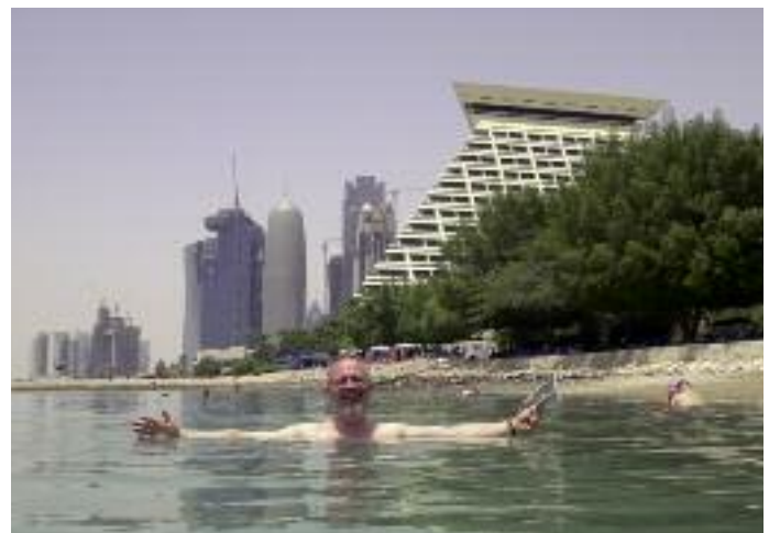
Bad im arabischen Golf (im Hintergrund ein Teil der Skyline von Doha).