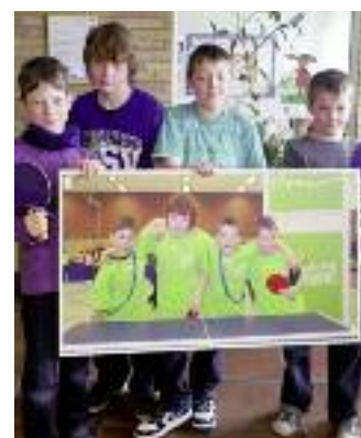
Einen iPONG-Tisch gewannen auch die „Fantastic Four“ der 4. Klasse der Grundschule Edesheim.