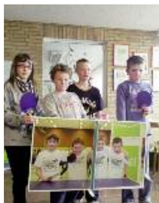
„Die starken Spieler“ der 3. Klasse der Grundschule Edesheim.