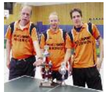
So sehen Sieger aus: die Herren des MTV Embsen.