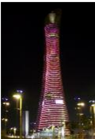
Das Hotel „The Torch“.