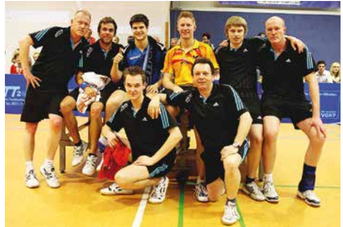
TSV Algesdorf feiert 100-jähriges Jubiläum mit Ovtcharov und Filus.

Die Entstehungsgeschichte des Algesdorfer Tischtennis beginnt zunächst wesentlich bescheidener. Als im Jahre 1968 ein Tischtennistisch (nach Aussagen der Beteiligten war