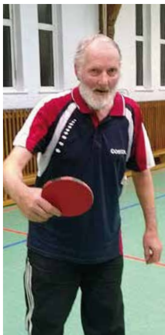
Auch mit 75 Jahren weiterhin aktiv an der „Platte“.