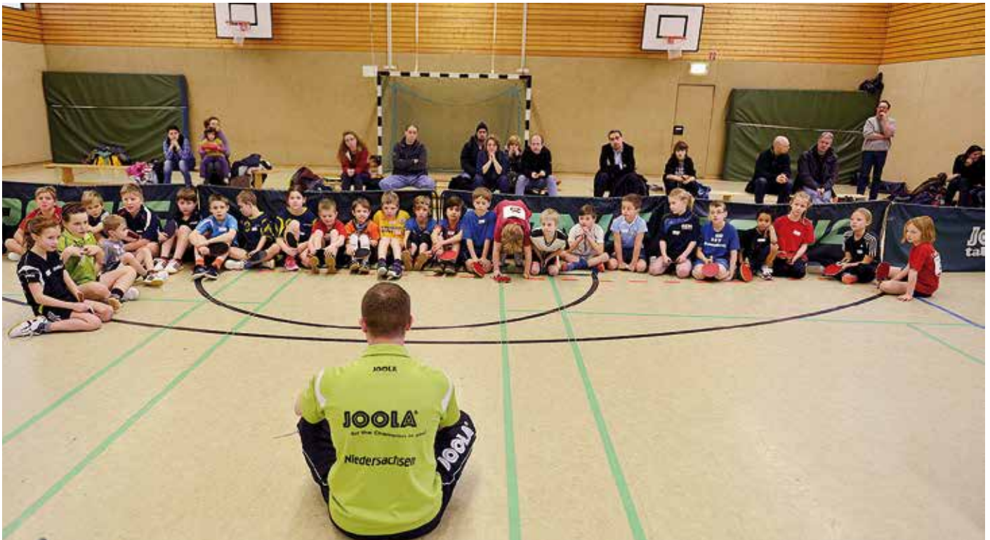
Der TTVN freut sich auf zahlreiche Teilnehmer.