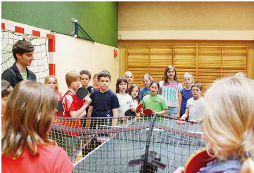
Der Tischtennisroboter des TTVN-Schnuppermobils erfreut sich besonderer Beliebtheit

Mit dem TTVN-Schnuppermobil wird den Vereinen eine herausragende Möglichkeit zur umfassenden Mitgliedergewinnung geboten. Besondere Berücksichtigung findet dabei das Thema „Integration durch Sport“, das aufgrund der stetig steigenden Anzahl an Kindern mit Migrationshintergrund immer wichtiger wird. Die Vereine erhalten dazu vom Teamer zahlreiche Tipps und weitere Ansprechpartner, wie man die Mitglieder-