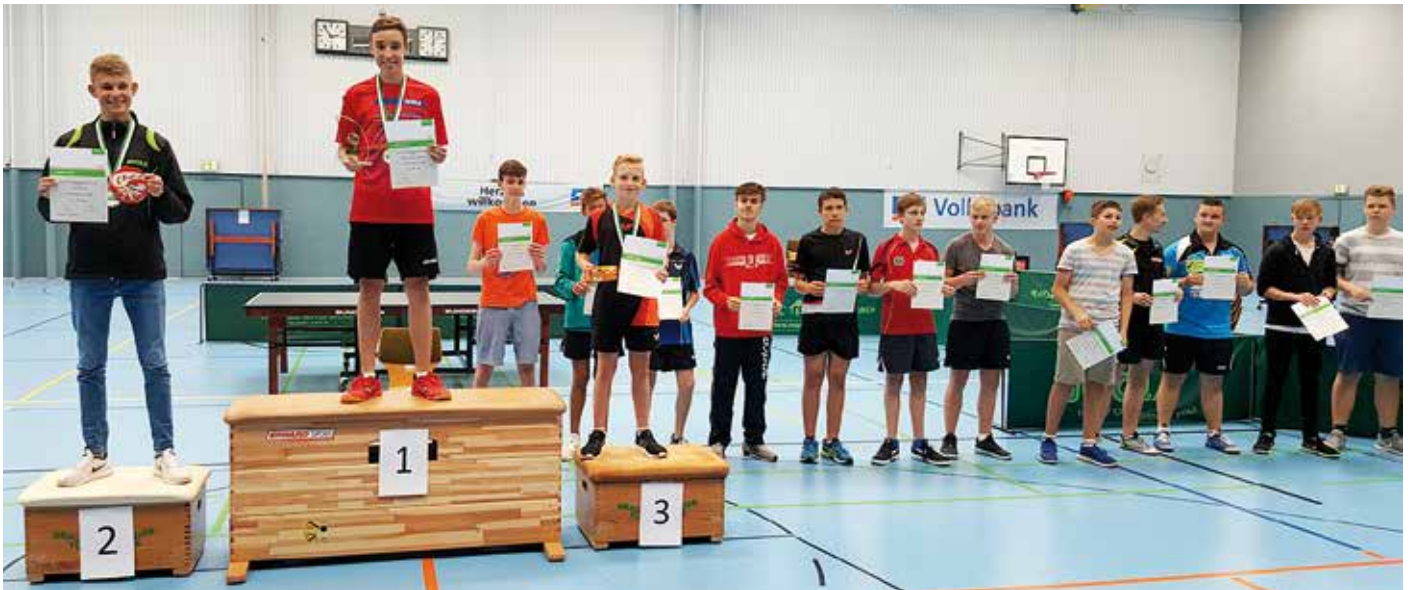
Nach der Siegerehrung stellten sich die Teilnehmer der Jungen zum Gruppenfoto.