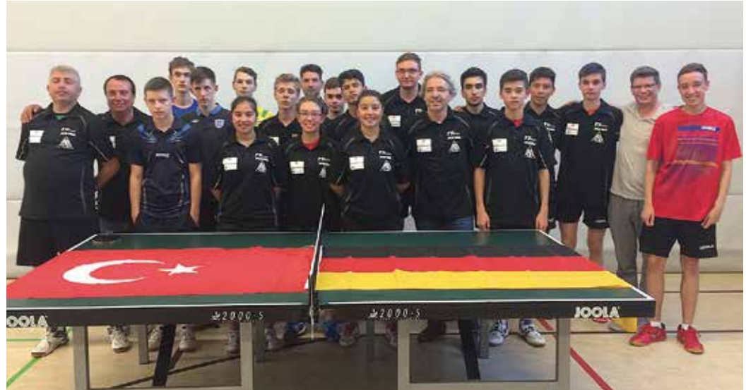
Tolles Projekt des SV Arminia Hannover: Der Deutsch-türkische Jugendaustausch.