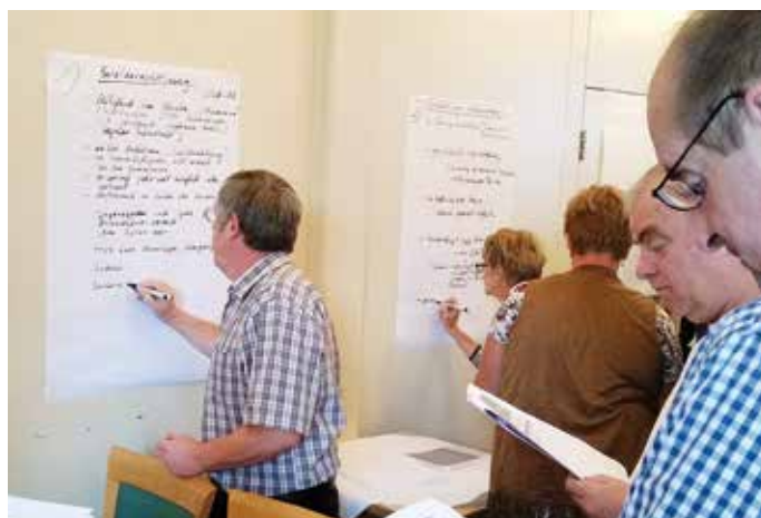
Bei der Gruppenarbeit: Die Teilnehmer der WO-Coach-Ausbildung in Twistringen halten die Ergebnisse zu den Themen „Spielberechtigung/Wechsel der SB“ und „Schüler/Jugendliche“ auf Plakaten fest.