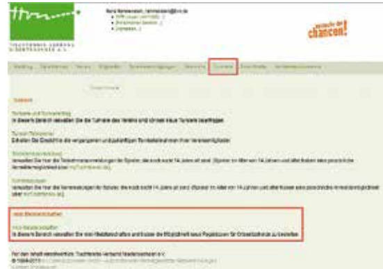
Abbildung 1: Die Anforderung von Regieboxen und Eingabe der Veranstaltungsberichte erfolgt über den passwortgeschützten Vereinsbereich von click-TT unter der Rubrik „Turniere“.

Zwischen dem 1. September 2016 und dem 15. Februar 2017 können in Niedersachsen wieder alle Vereine, Schulen