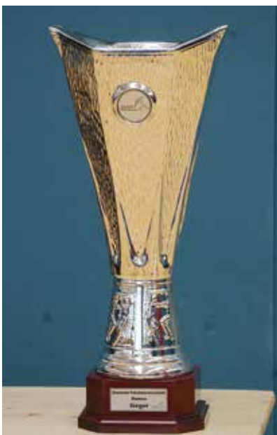
Das Objekt der Begierde: Der Wanderpokal für den Damen-Pokalsieger in der Saison 2016/2017 – derzeit im Besitz des zweimaligen Titelverteidigers ttc eastside berlin.