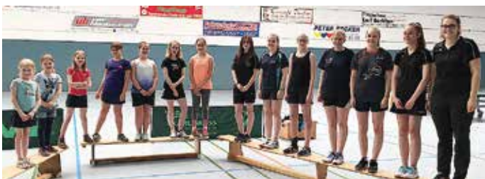
12 Mädchen nahmen am ersten Mädchen-Camp teil und genossen neben dem Training die Zeit im Kletterwald oder beim Austausch am Lagerfeuer.