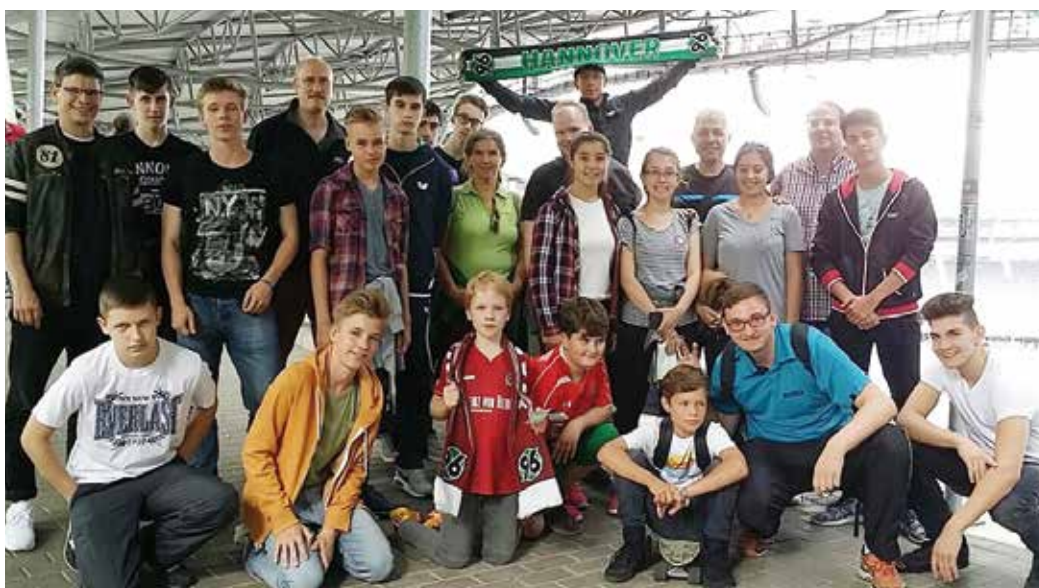
Das abwechslungsreiche Programm beinhaltete unter anderem auch einen Besuch der HDI-Arena.

nen unsere Stadt zu zeigen“, resümiert Bartels. Für den 22-jährigen steht bereits fest, „im nächsten Jahr starten wir einen Gegenbesuch in der Türkei“. Bis dahin werden die neu geschlossenen Freundschaften über Smartphone gepflegt. „Wir haben eine gemeinsame WhatsApp-Gruppe, über die wir in Kontakt bleiben“, erklärt Jasper Uphus, Freiwilligendienstleistender bei Arminia, der ebenfalls im Organisationsteam am Projekt „Jugendaustausch auf Tischtennis“ mitwirkte. René Rammenstein