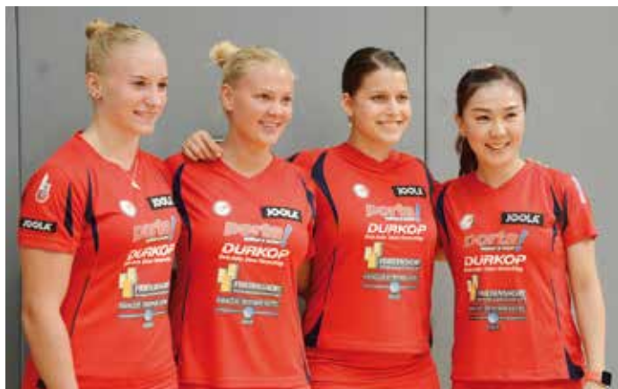
Lediglich zwei Sätze gab der Titelverteidiger ttc eastside berlin mit Chantel Mantz (v. l.), Georgina Pota, Petrisa Solja und Shan Xiaona in seinen beiden Begegnungen ab.