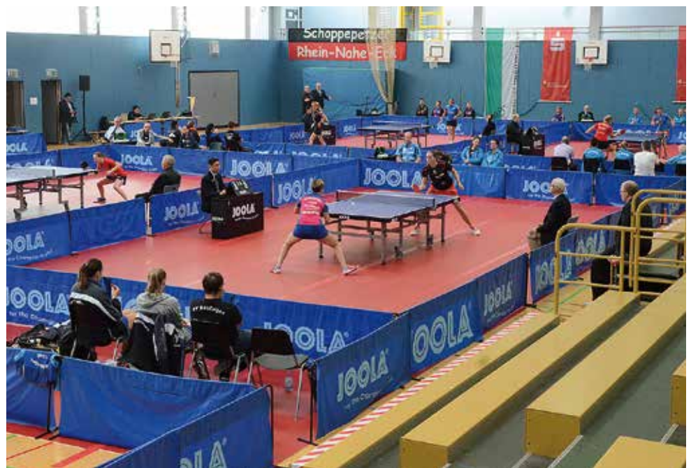
Ideale Spielbedingungen hatten die teilnehmende Mannschaften in der Sporthalle in Seligenstadt vorgefunden.