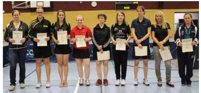
Die Teilnehmerinnen Bezirksendrangliste Damen.