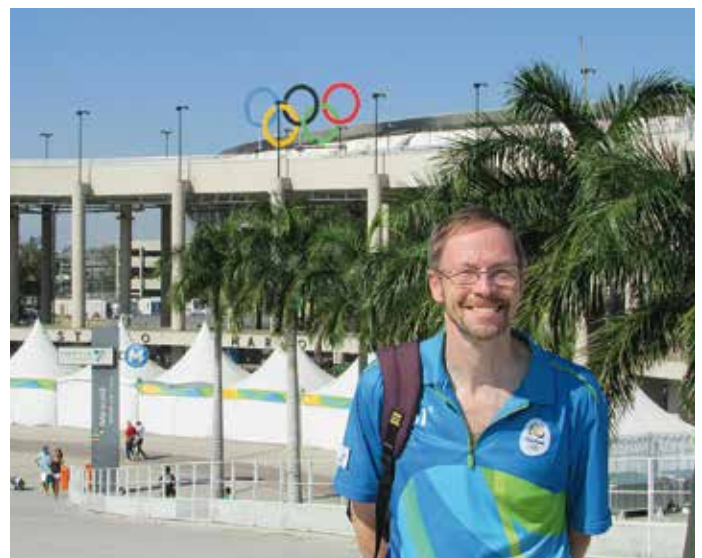
Der 60-Jährige vor dem Maracana-Stadion.