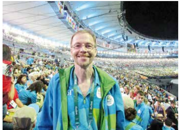
Ein Erinnerungsfoto aus dem Maracana-Stadion vor dem Beginn der Eröffnungsfeier.

auf Englisch, „sie hat es sofort akzeptiert und dann auch umgesetzt.“ Höhne hält ohnehin große Stücke auf die Weltmeisterin und Olympiasiegerin. „Sie ist sehr sympathisch, hat immer ein Lächeln auf den Lippen, macht einen sehr smarten und intelligenten Eindruck. Dazu ist sie sehr hübsch“, findet Höhne.