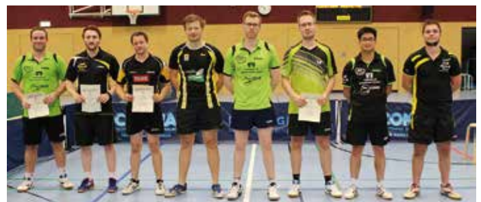
Die Teilnehmer Bezirksendrangliste Herren.