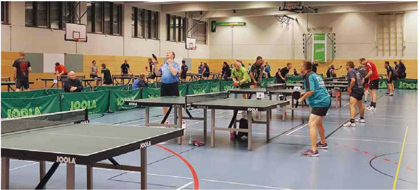
Großen Andrang gab es bei den gleich drei parallel laufenden TTVN-Races am Samstagabend.