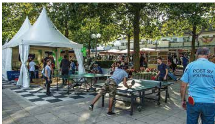
Im Gepäck verschiedene Tischgrößen, vom normalen Tisch bis zum mini-IPong Tisch. Der Ballroboter im Zelt durfte natürlich nicht fehlen.