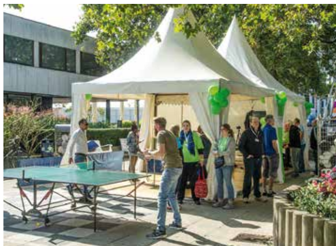
Bei bestem Wetter konnten Schaulustige selbst zum Schläger greifen und mit Freunden, Familie oder Bekannten ein kleines Match spielen.