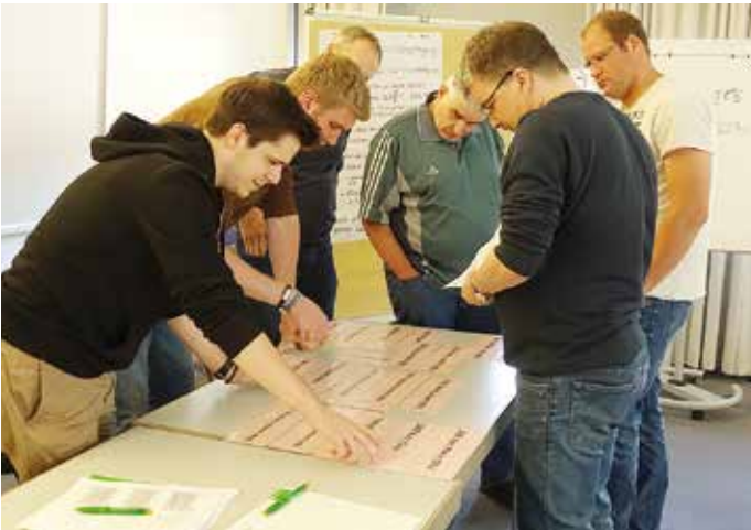
Neben zwei Wo-Coach-Fortbildungen wurden auch 20 neue WO-Coaches ausgebildet.