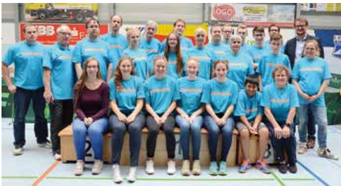
Ein großes engagiertes Team des SV Blau-Weiß Emden-Borssum beeindruckte als hervorragender Gastgeber.