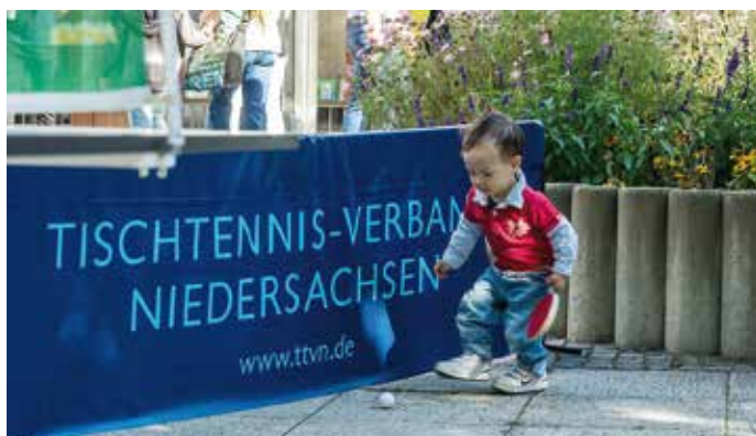
Auch die Kleinsten griffen zum Schläger und machten sich mit dem neuen Spielzeug vertraut.