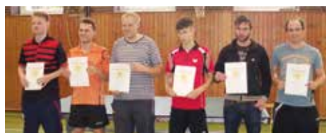
Die sechs besten Spieler der Bezirksendrangliste stellten sich gemeinsam dem Fotografen.