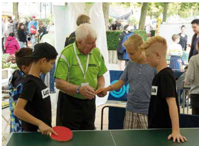
Viele freiwillige Helfer unterstützten den TTVN und den Tischtennis-Stadtverband Wolfsburg im Aktionszelt.