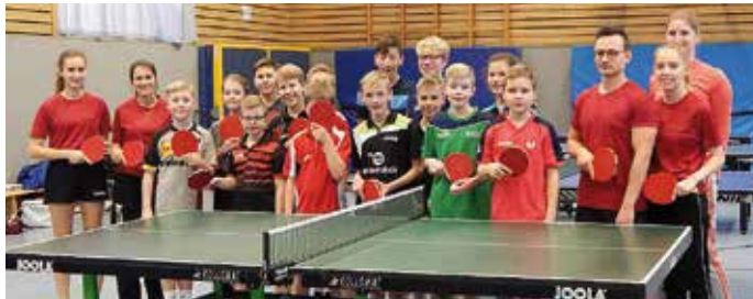
Der erstmals vom ESV Achim/Börßum veranstaltete Tageslehrgang für Jugendliche des Vereins sowie eingeladene Spieler wurde zu einem glänzenden Erfolg.

Mobil 01719309111, E-Mail: j.pfoertner@t-online.de