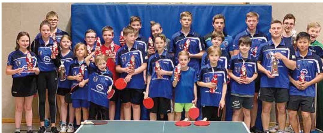
Der HTV-Nachwuchs freute sich zu Weihnachten über kleine Präsente.