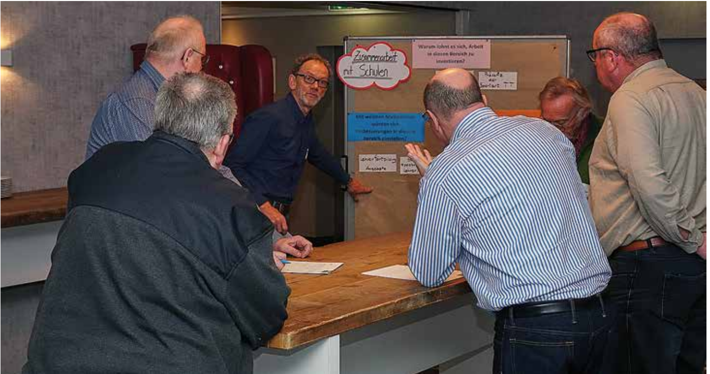
Kleingruppenarbeit zum Thema „Zusammenarbeit Schule und Verein“.