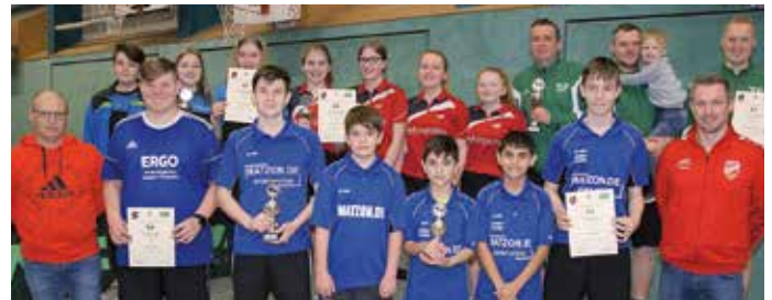
Das sind die Sieger und Platzierten beim Nachwuchs.