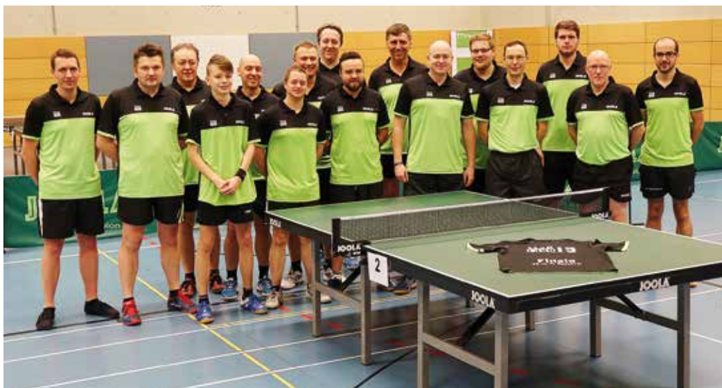
Die 16 Finalteilnehmer setzten sich aus rund 1300 Spielern und Spielerinnen durch.

Eine Bildergalerie von der Finalveranstaltung findet sich auf dem TTVN-Facebook Profil unter www.facebook.com/ttvn.del . René Rammenstein