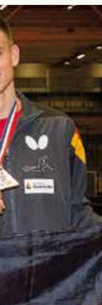
(Tschechien) l und Dominik iligt.