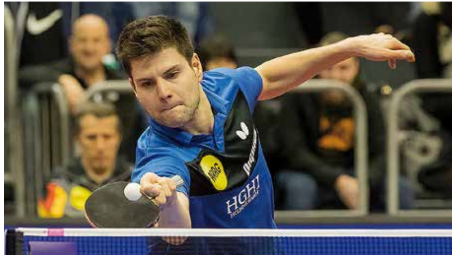
Einen sehr starken Eindruck hat Dimitrij Ovtcharov mit Platz drei hinterlassen und schrammte knapp am Endspiel vorbei.

Wie fast alle Aktiven und Trainer hatte Ovtcharov am ersten Februar-Wochenende in der GETEC-Arena bereits Olympia im Hinterkopf. Er fühlte sich in der Halle sichtlich wohl. „Schade, dass sich Magdeburg in nächster Zeit nicht für die Olympischen Spiele bewirbt“,