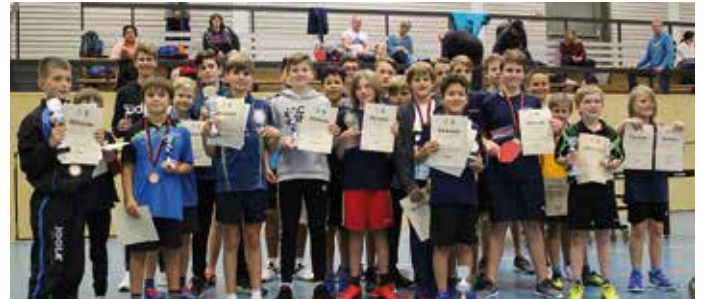
Das sind die Sieger und Platzierten der Jugend 11 und 15.