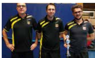
Mit einem knappen Erfolg sicherte sich SuS Emden in der D-Klasse den Sieg.