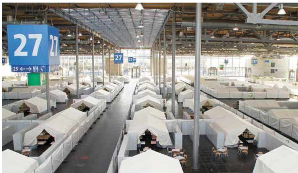
Voneinander abgetrennte Zeltdörfer für die Geflüchteten stehen in der Halle 27 der Messe Hannover.