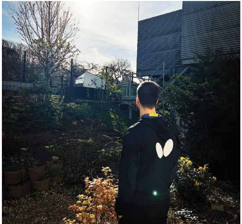
Sehr nachdenklich: Tischtennis-Weltstar Dimitrij Ovtcharov.

Der ehemalige Weltranglisten-Erste hatte seit seiner komplizierten Knöcheloperation im Oktober allerdings kein Spiel mehr für den Verein, der vom russischen Energiekonzern Gazprom gesponsert wird, bestritten. Mit Fakel Orenburg gewann Dimitrij Ovtcharov, der bereits 2010 vom belgischen Topklub Royal Vilette Charleroi an den südlichen Ural wechselte, viermal die