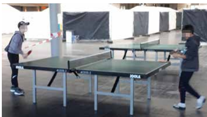
Mal auf andere Gedanken kommen: TT-Tische sollen für Geflüchtete für ein wenig Abwechslung in dieser schweren Ausnahmesituation sorgen.