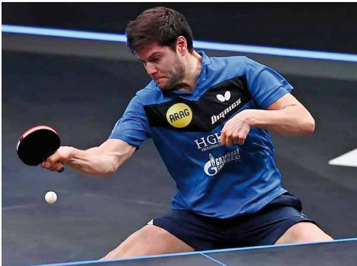
Die letzte deutsche Station für Dimitrij Ovtcharov war Borussia Düsseldorf, ehe der Weg über den belgischen Topklub Royal Vilette Charleroi zu Fakel Gazprom Orenburg führte und nun nach zwölf Jahren zurück nach Deutschland zum TTC Neu-Ulm.