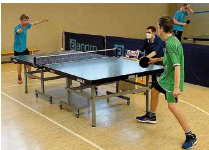
Spannende Spiele lieferten sich die Jungen beider Schulen, wengleich die Spieler der Schule im Bockfeld Hildesheim-Himmelsthür – Spieler hinten im blauen Trikot – klar überlegen waren.