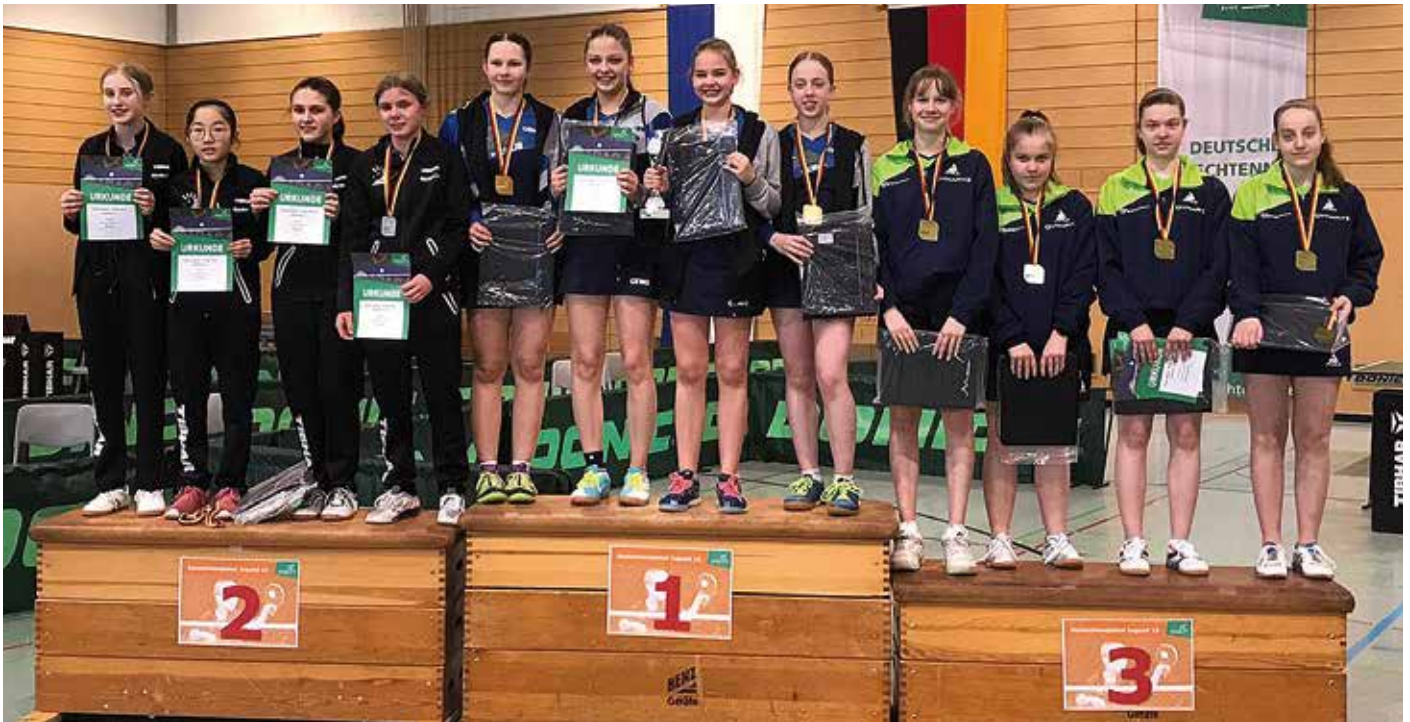
Nach der Siegerehrung Jugend 15 stellten sich die platzierten Teams zum Gruppenfoto: Baden-Württemberg (v. l.), Hessen und Niedersachsen.