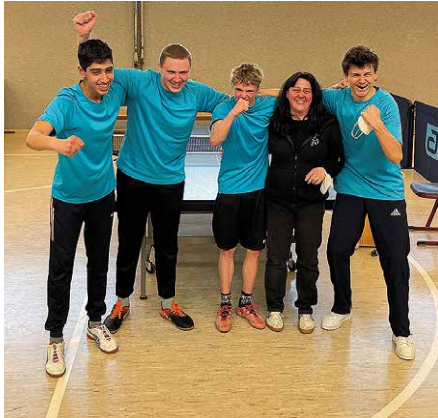
Das Team der Schule im Bockfeld Hildesheim-Himmelsthür siegte im Landeswettbewerb „Jugend trainiert für Paralympics“ mit einem 6:0-Erfolg gegen die Schiller-Schule Wolfsburg.