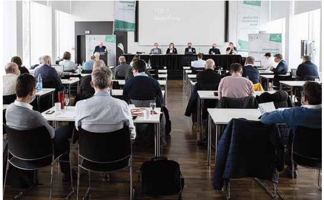
In der Evangelischen Akademie in Frankfurt/Main fand zum ersten Male der DTTB-Bundesrat statt. Hier ein Blick in den Versammlungssaal mit dem Präsidium an der Stirnseite.