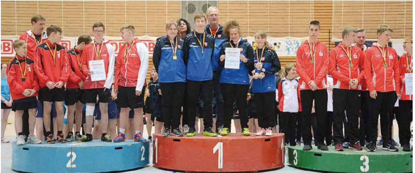
Rückblende 2019: Ihren insgesamt achten Titel – eine Erfolgsgeschichte für die Ewigkeit – errang die Heinrich-Böll-Schule Göttingen beim Bundesfinale „Jugend trainiert für Olympia & Paralympics“ 2019 im Helmut-Korber-Sportzentrum in Berlin.