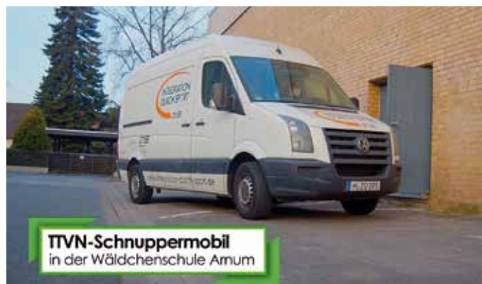
Das TTVN-Schnuppermobil begeistert Schülerinnen und Schüler der Wäldchenschule in Arnum.

probieren. Außerdem wurde das anstehende Osterfest mit