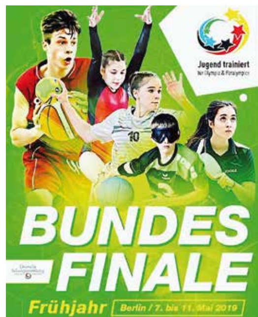
Mit dem gemeinsamen neuen Logo (oben rechts) und dem Schriftzug „Jugend trainiert für Olympia & Paralympics“ präsentiert sich das Frühjahrsfinale des Bundeswettbewerbs – wie hier mit der Titelseite des Programms 2019.