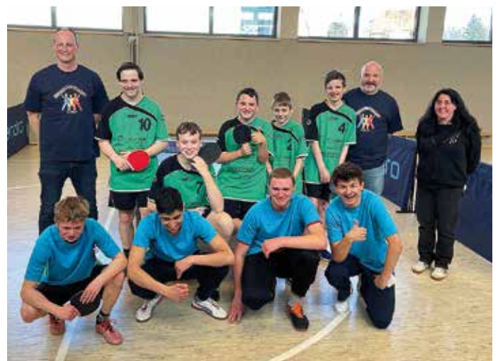
Nach dem Finale stellten sich die Spieler beider Schulen mit ihren Betreuern zum Erinnerungsfoto.