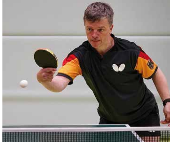
Björn Schnake holte Bronze bei den Paralympics in Tokio 2021.