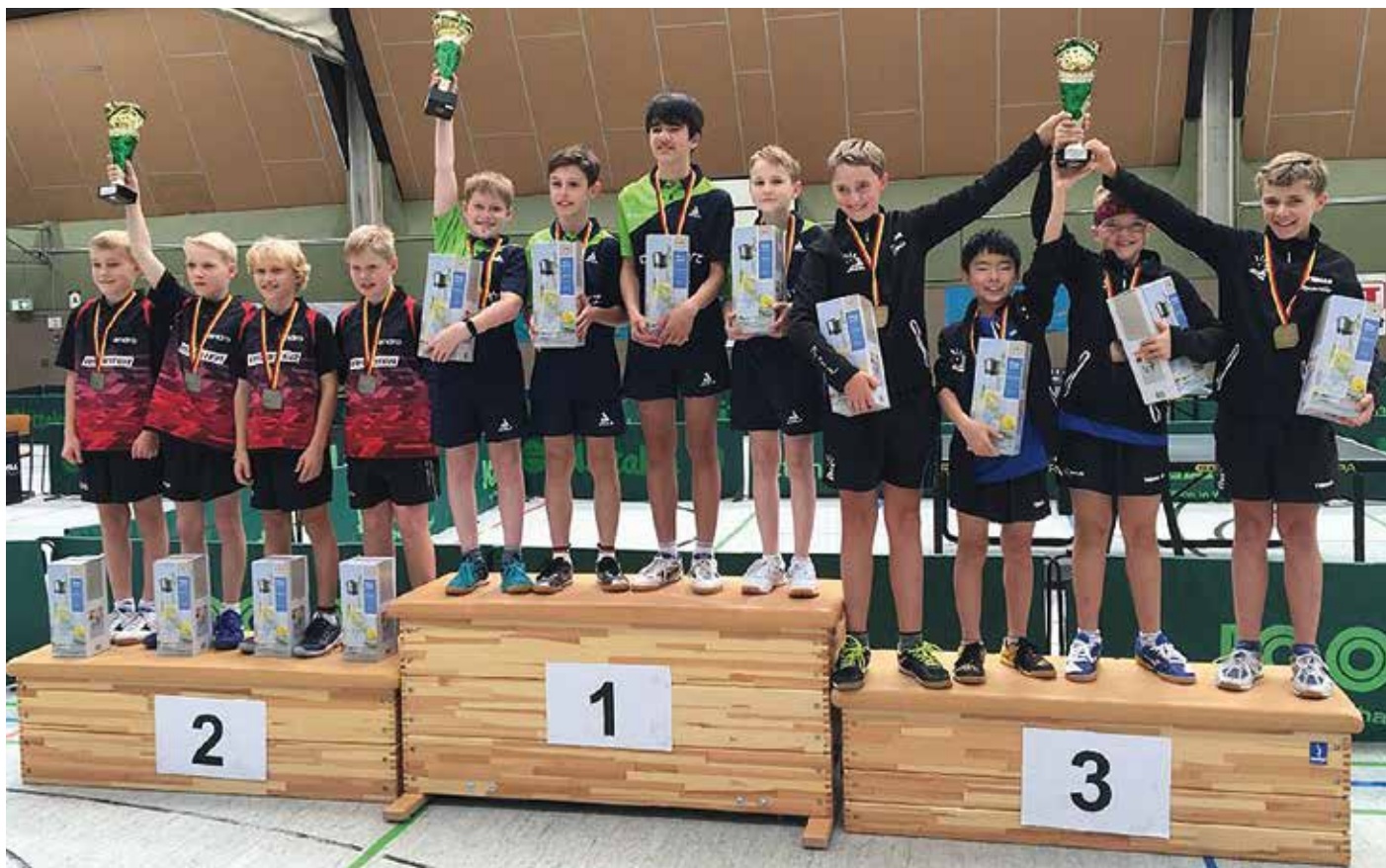
Bei der Sichtung in 2021 stand das TTVN-Jungen Team ganz oben auf dem Podest.