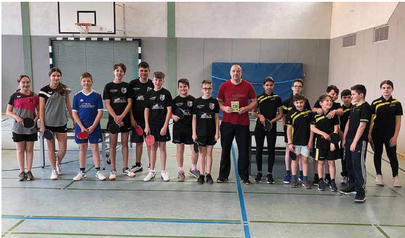
Das erste TTVN-Kids-Race beim SC Börry findet großen Anklang.